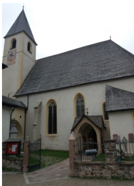
Unsere liebe Frau im Walde