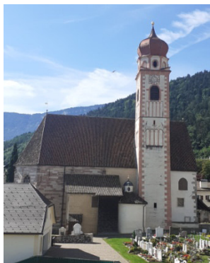
Maria Himmelfahrt Tisens