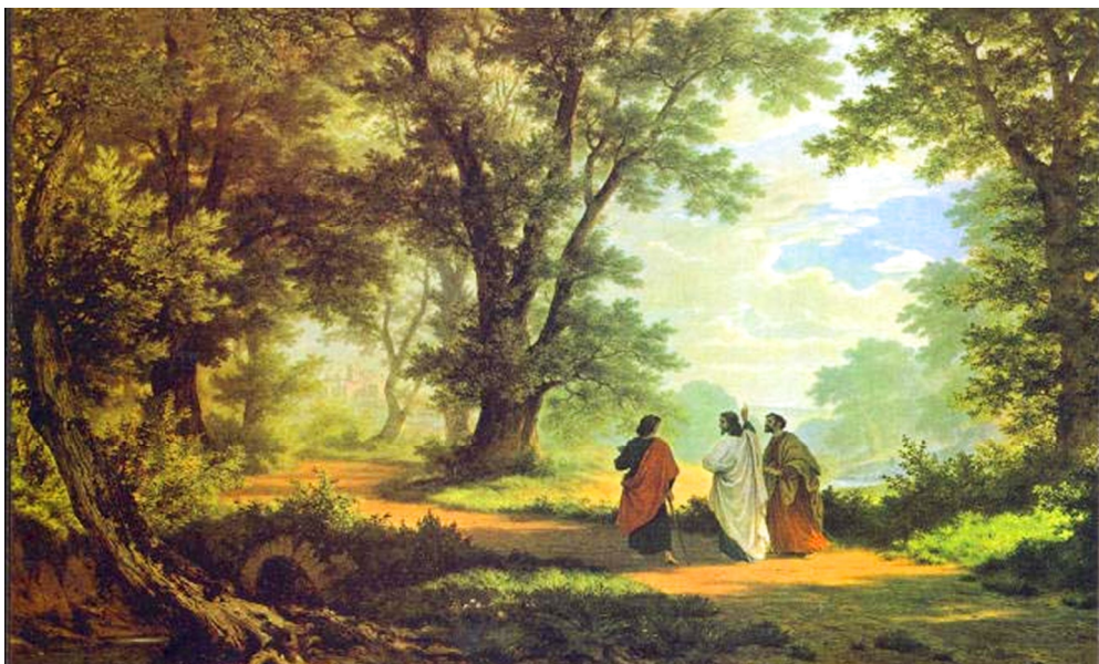
Der Gang nach Emmaus (Lk 24, 13-35)

Nr.11 - Lesejahr A 2025/2026 Mo der 2. Osterwoche bis 4. So. der Osterzeit